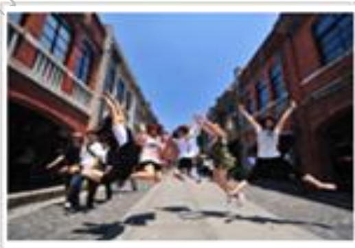
國立傳統藝術中心(OT)