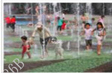
台北松山運動中心OT