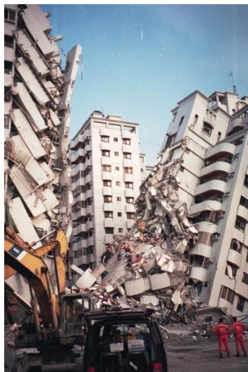
臺中縣金巴黎社區大樓倒塌現場