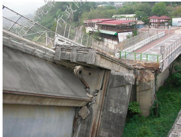
921大地震造成石岡壩溢洪道及閘門斷裂受損之情況